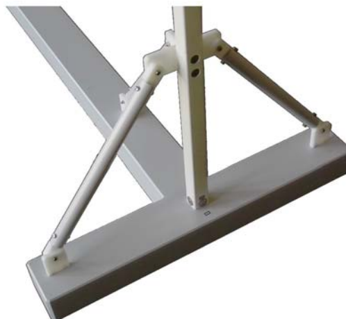
Bild 4: T-förmiger Standfuß mit vertikaler Stütze und Streben (S2, S3, S4, Blick von oben) Fig. 4: T-shaped stand with vertical loop bearing (S2, S3, S4, view from above)