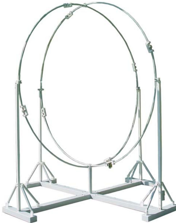
Bild 12: Standfuß mit zwei vertikalen Ringen Fig. 12: Support stand with two vertical rings

Step 4: Mounting the second vertical ring (YA-YD) at the stand (above S1 and S3) In general the mounting of the second ring is similar to the first, but the closing of the ring is made after pushing the second ring through the first one. This ensures that ring Y is above ring Z at the bottom and top connection points and therefore all rings have the same diameter. After having closed the ring and tightening the connections, the ring can be erected and put into the correct location. The current transformer of the second ring must be close to the central stand bearing (recommended spacing: 20 cm), facing towards the coaxial switching unit at S1. The ring can be snapped into the clamp at the central support bearing and at the vertical stand bearing above S3. At the opposite side (S1) the ring is only guided loosely and will be fixed later. 4 clamps with screws M3 x 40 are used to connect the loops Y and Z at the topmost crossing point.