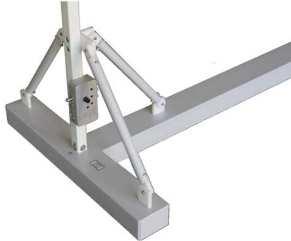
Bild 3: T-förmiger Standfuß mit vertikaler Stütze, Streben und Koaxialumschalter (S1, Blick von oben) Fig. 3: T-shaped stand with vertical loop bearing and coaxial switching unit (S1, view from above)